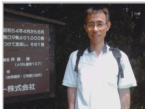
【写真】2011年の夏。30年ぶりの伊良湖岬にて。 「高校生の頃、南の島から流した私の椰子の実が日本に漂着しました。」

私はこのような経験もあり、「トラブルとは思わぬところから起こりうるもの」と思っています。父親はボケてはいませんが、自分ではしっかりしているつもりでも、まんまと騙されてしまうこともあります。そんな時、家族の誰かが「司法」の力で解決