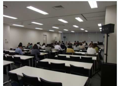
10月26日に開催した協議会の模様

その他にも、常勤弁護士と職員による、関連機関職員の方向けの説明会や事務所見学等を随時受け付けておりますので、ご要望がございましたら、ご連絡ください。