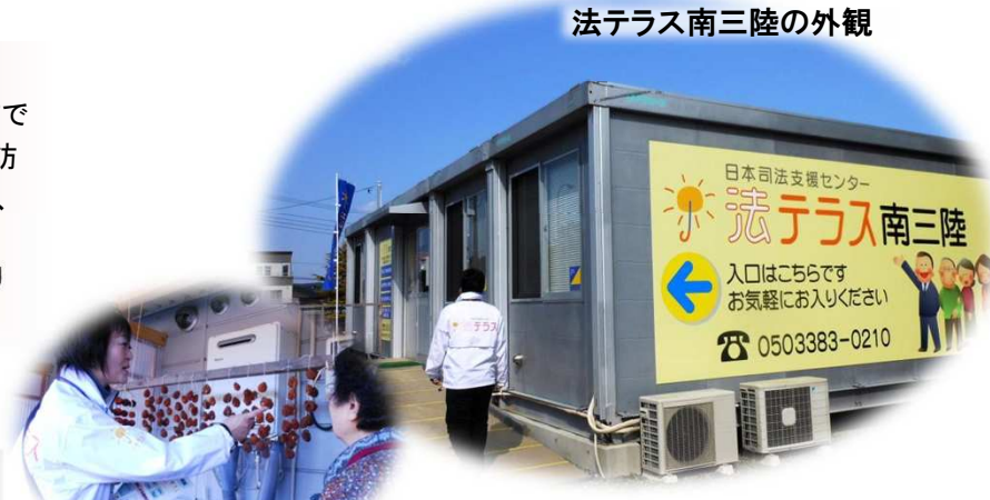
法テラス職員による各戸訪問の様子

開所当初、「法テラスはなにっさ」という方でいっぱいでした。これではダメだと、各戸訪問でPRをしました。それから2年。今では、多くの方が「法テラスさ行ったほうがいいよ」と法テラスの応援団になりました。ありがたいものです。