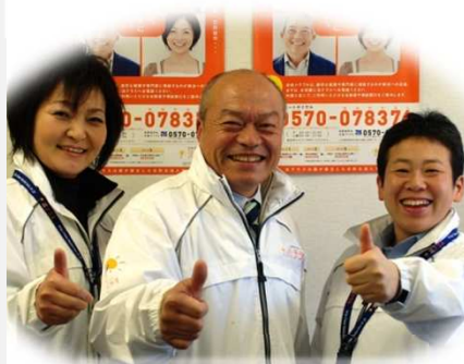
法テラス南三陸の職員

法テラスが開所して2年になりますね。当初、町民は「法テラスってなにっさ」という感じでしたね。南三陸町では、一人でも多くの方にお悩みを相談して頂きたい為に、防災行政無線広報や法テラス作成の「季刊ニュース」を南三陸町の広報誌と合わせて全戸配布にご協力をさせて頂いています。今では、法テラスの存在感が非常に高まりましたね。高台移転工事や土地の買い上げで相続などの問題が多く発生しています。法テラスは、これからが相談の正念場になるのではないのでしょうかね。