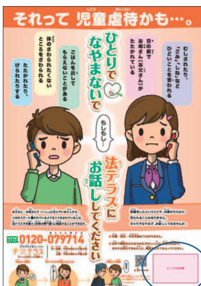
学校掲示用ポスター

また、法テラスでは、学校における制度周知用ポスターの掲示、同ダイヤルの電話番号の記載されたポケットカードの配布、制度周知用アニメーション動画のYouTube配信等により制度周知を図っている。