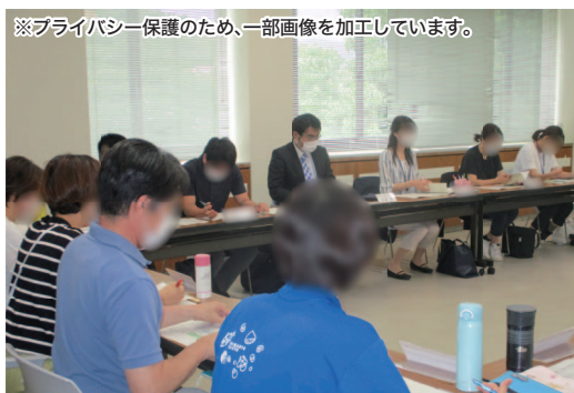
要保護児童対策地域協議会に参加している法テラスの常勤弁護士（右から4人目）

一部の地域では、法テラスの常勤弁護士が、要保護児童対策地域協議会に参加している。個別ケースについての助言を行うとともに、要保護児童に関する地域の体制整備に関する協議を地域の関係機関と共同して行っている。