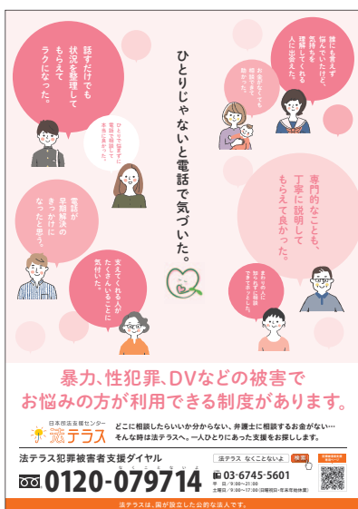
被害にあわれた方向けポスター

犯罪被害者支援ダイヤルは、DV、ストーカー、児童虐待、性被害、職場のいじめを含む様々な被害について、犯罪被害者支援の知識や経験を持ったオペレーターが、無料で法制度紹介や相談窓口案内を行うサービスであるが、こども本人からの問合せにも対応している（詳細は121ページ参照）。