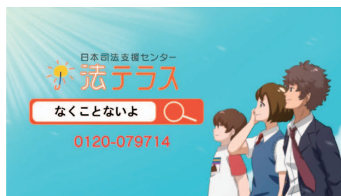
制度周知用アニメーション動画