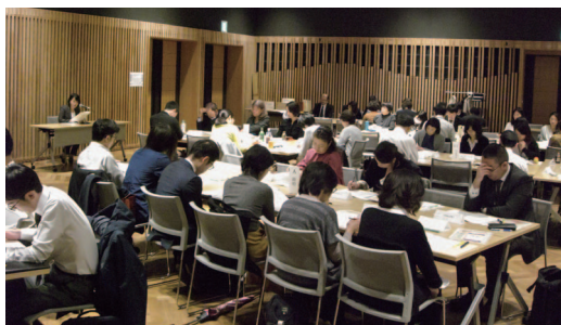
地方協議会の様子

法テラスでは、全国の地方事務所において、地域の実情に応じた業務運営を実現するため、地域の関係機関・団体が参加する地方協議会を開催している。例えば、自治体の子育て支援課、教育委員会、児童相談所、学校、警察署といった関係機関が参加して、「女性と子ども」をテーマに地方協議会を開催した例もある。離婚・DV等、児童虐待・貧困・多重債務をテーマにしたグループワークを実施した上で、現場における法テラスの活用の仕方や地域の相談体制整備について意見交換を実施している。