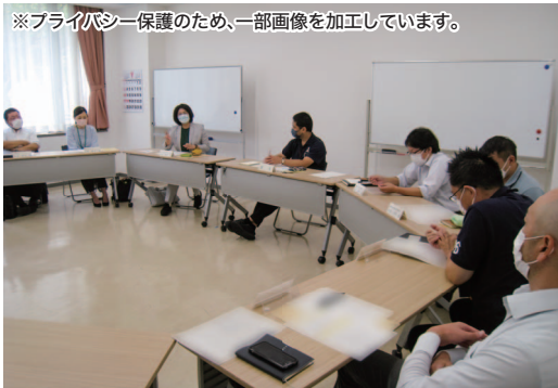
生活困窮者支援調整会議に参加する法テラスの常勤弁護士（左から3人目）

地域によって実施状況に差があるが、法テラスの常勤弁護士が、生活困窮、DV、その他の法的問題を抱える家庭に関する支援者のケース会議に参加している。また、一部地域における期間限定の取組であるが、常勤弁護士以外の弁護士がケース会議に参加する謝金を法テラスが負担するという取組も行なっている。ケース会議に弁護士も参加することで、法的問題を含む課題の整理、福祉関係者と弁護士の役割分担を行うことができる。