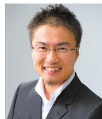
乙武 洋匡氏 (作家、東京都教育委員)