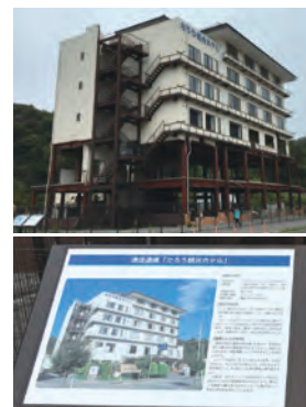
宮古市田老地区 津波遺構「たろう観光ホテル」

震災時に被災地域にお住まいの方であれば、弁護士に無料で法律相談ができます。高齢者で弁護士事務所に相談に行けないという方であれば、自宅での出張法律相談も可能ですので、遠慮なく、お近くの法テラスにご連絡ください。