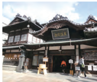
道後温泉本館：日本最古といわれる道後温泉のシンボル。平成31年1月から保存修理工事が行われています。

県内は、東予・中予・南予と3つの地域にわかれ、東予（東部地域）は、出荷額日本一の四国中央市の製紙、生産量日本一の今治市のタオルをはじめ、金属・機械・化学、造船などのものづくりが盛んです。中予（県中部）には、四国最大の人口を誇る松山市があり、道後温泉、松山城など県を代表する観光地があります。南予（南部地域）は、かんきつ類をはじめ、マダイ、生産量日本一の真珠など、農林水産物の産地として知られています。