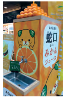
蛇口をひねれば「みかんジュース」!?（松山空港）

法テラス愛媛は、松山市の中心部に位置し、松山地方裁判所の向かいにあります。アクセスは市内を走る路面電車やバスが便利です。