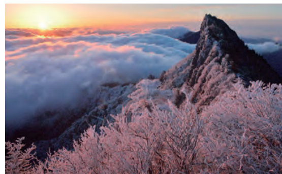
西日本最高峰の石鎚山（3月下旬）

法テラス宮古法律事務所もこの制度を活用しながら、被災者のご相談やご依頼に対応し、被災者の生活再建のお手伝いをさせていただきます。