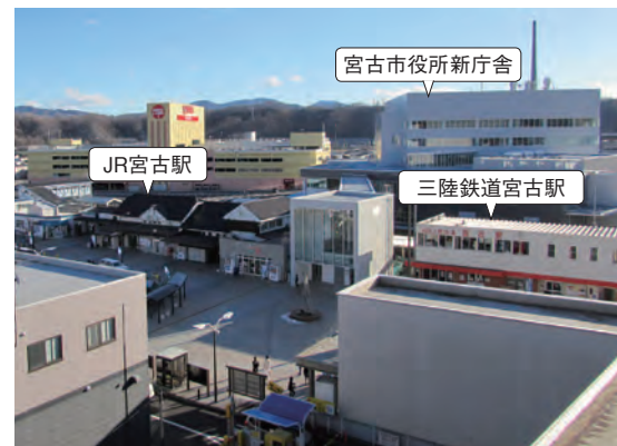
事務所から見えるJR宮古駅、三陸鉄道宮古駅周辺

また自治体、福祉機関の支援者の方々からの法律相談会の開催等のご要望も受け付けていますので、遠慮なく法テラス愛媛までお問い合わせください。